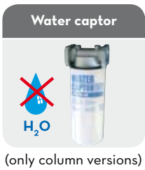
(only column versions)