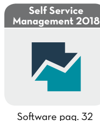
Software pag. 32