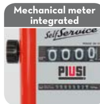
Mechanical meter integrated