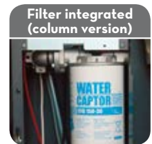
Filter integrated (column version)