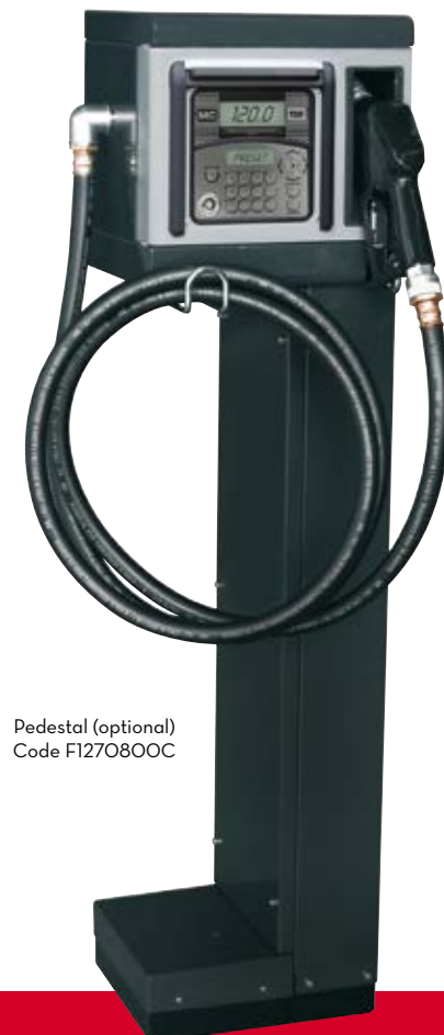
Pedestal (optional) Code F1270800C