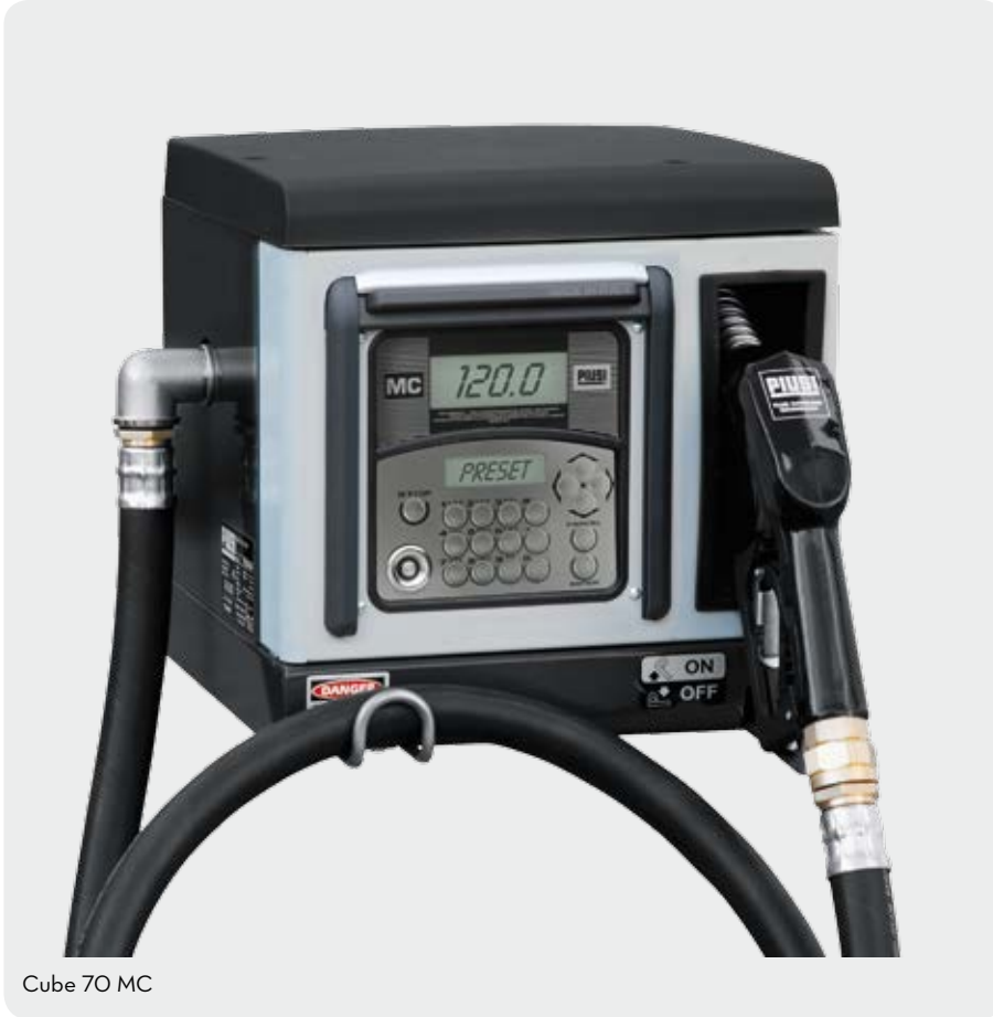
Cube 70 MC