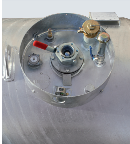
^ KC 1000-S ohne Flügeltürschrank