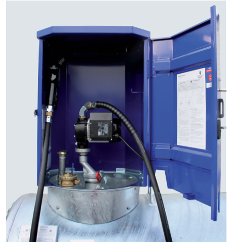
^ KC 1000-S mit Flügeltürschrank, Ausrüstung: Pumpe R50 230, Automatik-Zapfventil