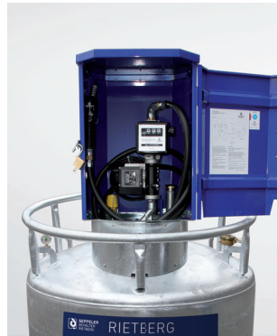
KC 995, Ausrüstung: Pumpe R50 230, Zählwerk, Flügeltürschrank, GWG