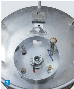
KC 995 ohne Flügeltürschrank